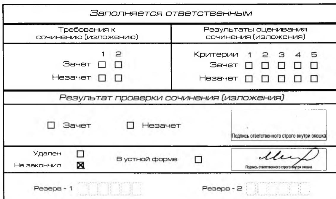
Рис. 12. Заполнение полей нижней части бланка регистрации (участник не закончил написание сочинения (изложения) по уважительным причинам)

В случае если участник итогового сочинения (изложения) по состоянию здоровья или другим объективным причинам не может завершить написание итогового сочинения (изложения), он может покинуть место проведения итогового сочинения (изложения). Члены комиссии по проведению итогового сочинения (изложения) составляют «Акт о досрочном завершении написания итогового сочинения (изложения) по уважительным причинам» (форма ИС-08), вносят соответствующую отметку в форму ИС-05 «Ведомость проведения итогового сочинения (изложения) в учебном кабинете ОО (месте проведения)» (участник итогового сочинения (изложения) должен поставить свою подпись в указанной форме). В бланке регистрации указанного участника итогового сочинения (изложения) необходимо внести отметку «Х» в поле «Не закончил» для учета при организации проверки, а также для последующего допуска указанных участников к повторной сдаче итогового сочинения (изложения) в дополнительные сроки. Внесение отметки в поле «Не закончил» подтверждается подписью члена комиссии по проведению итогового сочинения (изложения) (см. рис. 12).